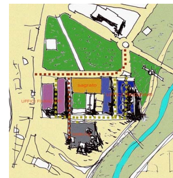
06. La cittadella costituita dagli Uffici finanziari e giudiziari è servita da un parcheggio che s'inscrive nel luogo grazie alla differenza di quota esistente tra la piazza Madonna delle Grazie e la via dell'Orto Agrario. Si costruisce così una unità composta dal Palazzo di Giustizia, dal convento della chiesa (ora Procura della Repubblica), dalla chiesa della Madonna delle Grazie e dagli uffici finanziari, e dal nuovo parcheggio.