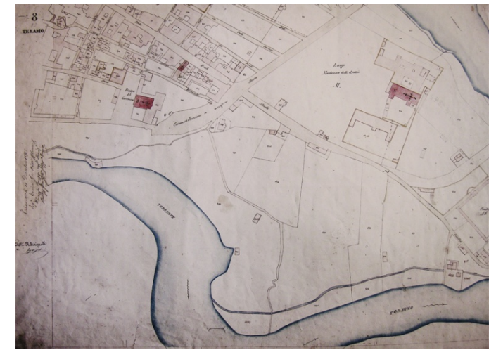
07. Teramo, Catasto urbano foglio 8, 1875

Torna a formarsi il sagrato della chiesa, e con la ridefinizione dell'antistante parco urbano e la linearizzazione della strada lì compresa, l'intero nucleo si costituisce nella sua unità complessa come satellite alla città storica. Il parco sarà dedicato alla memoria del musicista teramano Ivan Graziani intitolandolo "SIGNORA BIONDA DEI CILIEGI". Il progetto s'inquadra nel più ampio piano coinvolgente l'intera città storica e la cui fattibilità economica è in http://www.lucafalconi.it/wp-content/uploads/2008/07/doppio-senso-piano-finanziario-3.pdf