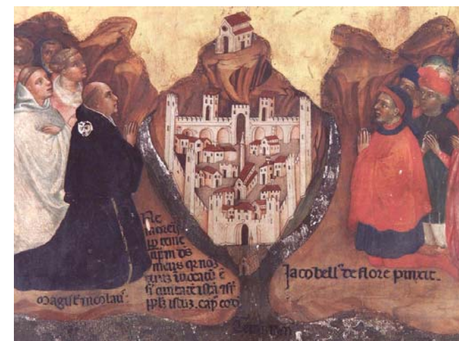
01. Teramo, Cattedrale. Polittico di Jacobello del Fiore, rappresentazione di Teramo e dedicanti

Sinteticamente due sono state le grandi operazioni di demolizione. La prima, distribuita nel tempo, è la rimozione della cerchia muraria. La finalità era recuperare