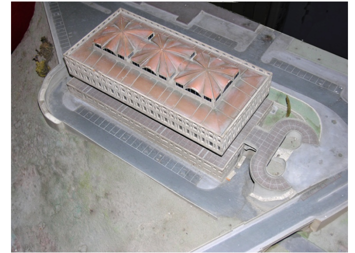
10. Modello del progetto originale del tribunale di Teramo, opera dell'arch. Gianfranco Caniggia. Si noti l'esedra d'accesso all'edificio e la relazione con il ponte S. Ferdinando.

La procedura progettuale attivata è di fatto semplice. È un'azione su una parte della città oggi molto marginale; sorta di retro della città. Al contempo è una rilettura della storia urbana come azione di trasformazione, da cui estrarre indicazioni su un possibile metodo di progetto: articolando i manufatti architettonici già presenti nell'area ricomponendoli in una sola unità fatta di parti autonome. Si inserisce il parcheggio come elemento funzionale che garantisce il senso anche economico della operazione edilizia e si agisce sulla storia dell'intero ambito urbano, riconoscendone proprio le peculiarità tipologiche e morfologiche.