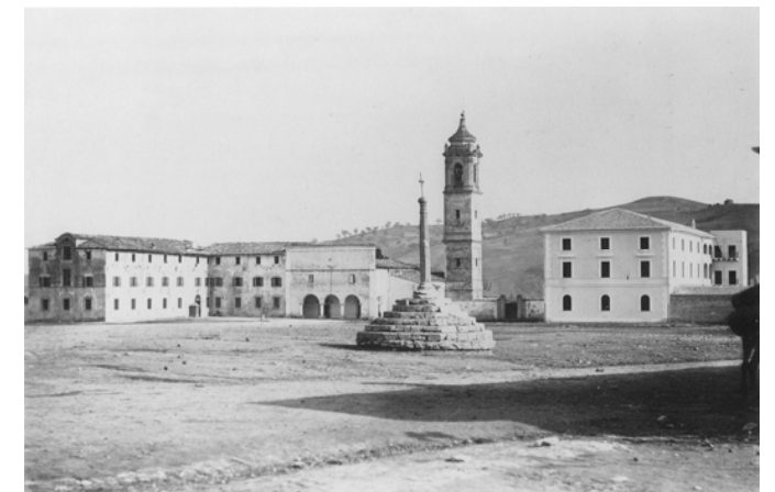
08. Il "campus". Largo Madonna delle Grazie, immagine storica