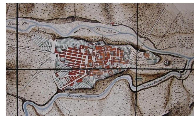
02. Pianta della città di Teramo Corpore reale del Genio 1852. IGM Firenze.