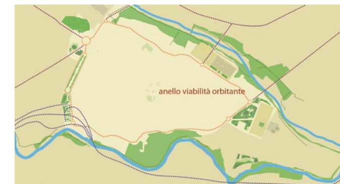
05. Il sistema delle Circonvallazioni storiche, tangenti alla mura urbane, diventa l' anello della viabilità orbitante su cui s'innestano i tre grandi parcheggi multipiano. Si avrà una razionale pedonalizzazione del centro città, ed una rete di "totem" elettronici informerà gli automobilisti della situazione dei parcheggi.

Spostandoci nel tempo giungiamo al 1847 quando terminarono i lavori di costruzione del ponte San Ferdinando (iniziati nel 1832-33). La data è un discriminante significativo nel recupero d'importanza dell'area. La documentazione